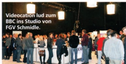
Videocation lud zum BBC ins Studio von FGV Schmidle.